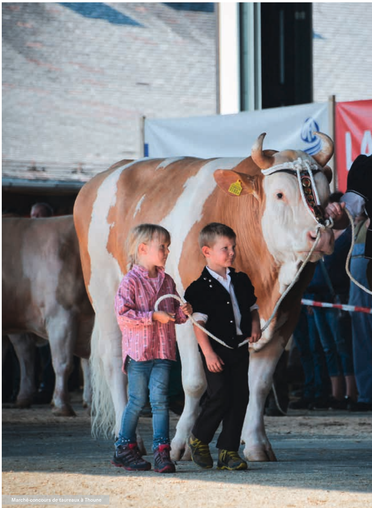
Marché-concours de taureaux à Thoune